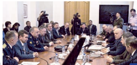
Омск принял «Вахту Героев»