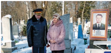
Память о Герое будет вечной