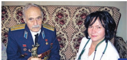
Милосердие без границ