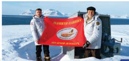
Огонь с Поклонной горы доставлен в Баренцбург